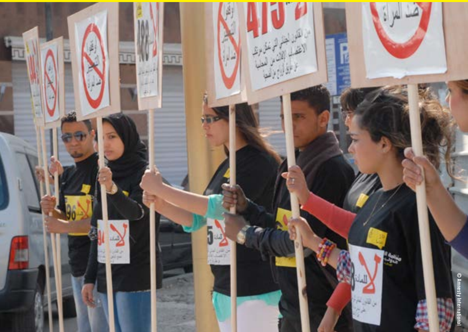
Image : Au Maroc, des militants d'Amnesty International manifestent contre l'article 475 et diverses lois discriminant les femmes, mai 2013. Jusqu'à sa modification en janvier 2014, l'article 475 permettait au violeur d'une mineure d'échapper aux poursuites s'il épousait sa victime (voir page 10).

Amnesty International est un mouvement mondial regroupant plus de 3 millions de sympathisants, membres et militants, qui se mobilisent dans plus de 150 pays et territoires pour mettre un terme aux violations des droits humains.